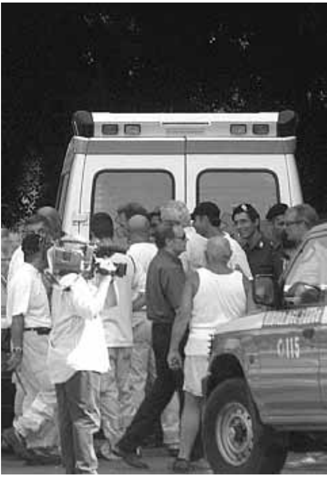
In alto: il crollo di uno dei fabbricati. Sopra: i controlli.

Ex cemeniteria. Oltre 50 chili di gelatina e 250 cariche per far crollare i primi edifici